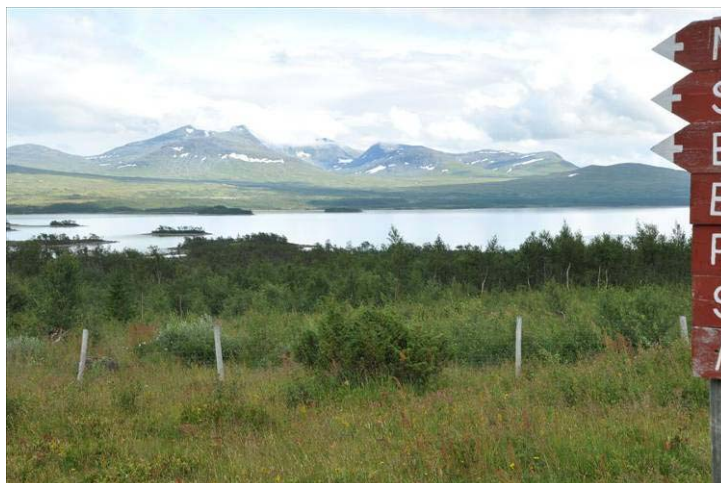
Sylarna från Storerikvollen

Göteborgsgänget som vi träffat dagen innan verkade sova gott i sitt (blöta) tält när vi lämnade Blåhammaren. Vi fick senare veta att de lämnade Blåhammaren kl 11.30 och satte kurs mot Storerikvollen. Mot slutet fick de syn på oss, men hann inte i fatt utan kom fram en halvtimme senare än vi. Det hade varit en riktig prestation - hinna ikapp ett pensionistgäng!